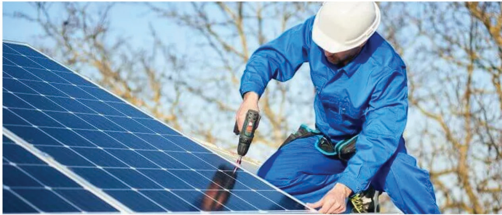
Bei Planung und Konstruktion einer PV-Anlage müssen nicht nur Standort und Umwelteinflüsse berücksichtigt werden.

In Deutschland steht die Energiewende aufgrund der derzeitigen Gaskrise auf der Tagesordnung der Politik sowie der Bevölkerung wieder weit oben. Photovoltaikanlagen sind daher eine echte Investition für die Zukunft, egal ob sie auf dem eigenen Hausdach, dem landwirtschaftlichen Gehöft oder auf der Freifläche entstehen. Im Zuge dessen soll selbstverständlich alles perfekt ablaufen und die eingebauten Module sollen einen hohen Ertrag abwerfen. Um dabei nicht auf Hindernisse zu stoßen, lohnt es sich, einen genauen Überblick über die möglichen Fallen, die bei der Konstruktion einer Dach- oder Freiflächensolaranlage auftreten können, zu haben. Mit welchen Mitteln können Verantwortliche sie einfach umgehen und wie hilft der prüfende Blick des Auftraggebers bei der Verwirklichung einer grüneren und rentablen Zukunft?