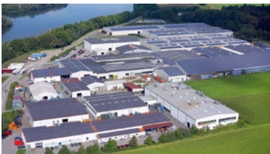
Projektreferenz: Mamming, Bayern Leistung: 1126 kWp Fertigstellung: 2013

Wir beraten Sie gerne zu den Möglichkeiten.