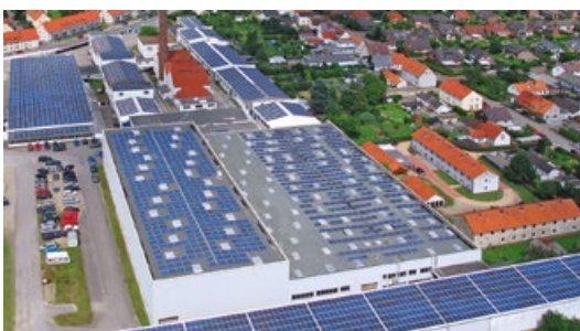
Projektreferenz: Bad Münde, Niedersachsen Leistung: 780 kWp Fertigstellung: 2012